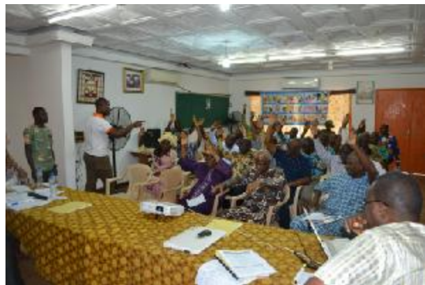
L'Assemblée lève la main pour donner son accord pour la gestion 2017 et reconduit le Directeur pour les 03 prochaines années

Conformément aux nouveaux textes en vigueur, l'Assemblée Générale Ordinaire se tient une fois par an dans la première quinzaine du mois d'Avril suivant la fin de l'exercice. A ce rendez-vous annuel il a été question de prendre connaissance des différents rapports (moral, d'activités et financier), de passer en revue la vie de l'organisation, les