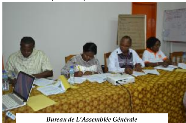
Bureau de L'Assemblée Générale